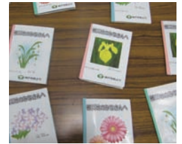
市役所ロビーいっぱい神戸市民からの応援メッセージが展示されていました。